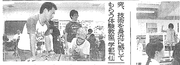
究、技術を身近に感じてもらう体験教室 学部「仙