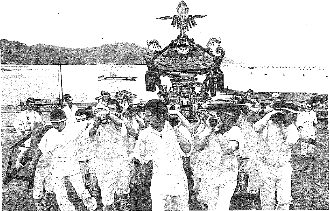
威勢のいい掛け声とともに氏子らが浜を練り歩いた